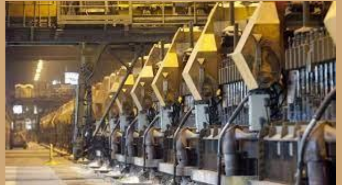
Fàbrica d'alumini a Dunkerque.