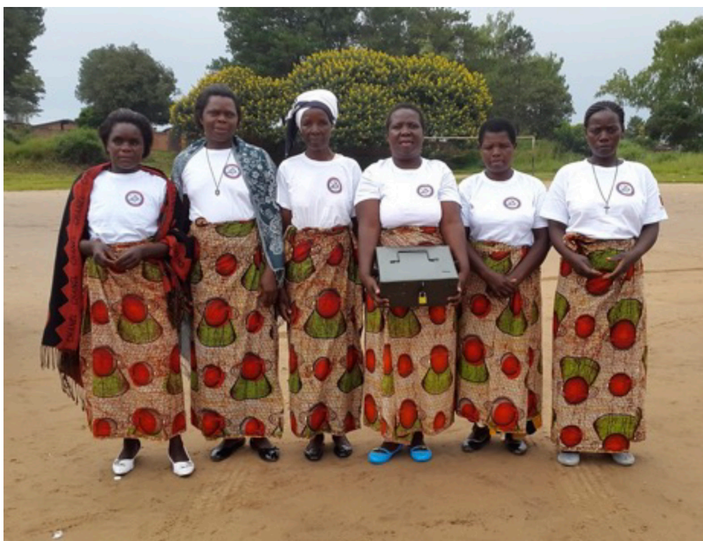
Dones de Malawi amb la seva caixa d'estalvi