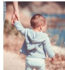
Cura dels infants