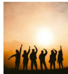
Amistat i relacions socials