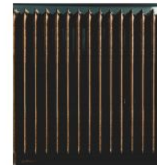
Accés a la calefacció