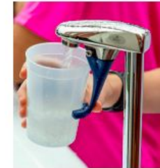
Accés a l'aigua potable