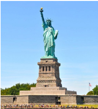
Nova York, Estàtua de la Llibertat

Obligatori: posar peu de fotografia (ciutat i posar el què apareix a la foto), per exemple: