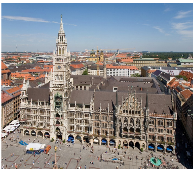
Imatge de la Marienplatz de