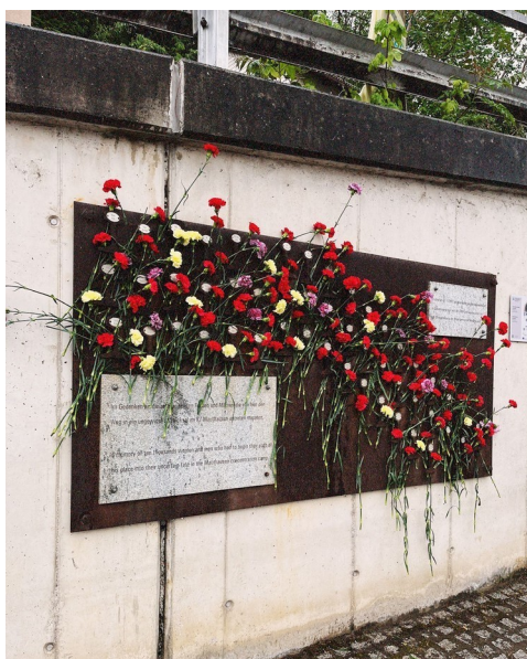
Imatge del monument commemoratiu a l'estació de trens de Mauthausen.