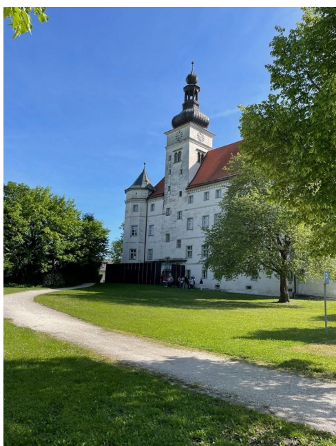
Munic Imatge del castell de Hartheim

Durant el migdia i la tarda, varem poder visitar la ciutat de Munic, capital de Baviera. A la nit, i després d'una forta tempesta de pluja, vam agafar l'avió cap a Barcelona.