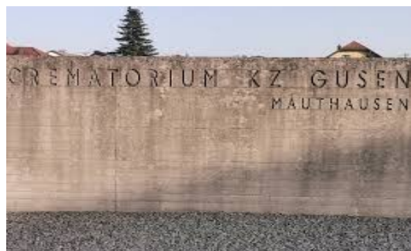
Imatge del camp de Gusen