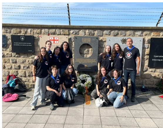
Imatge de grup davant del monument.