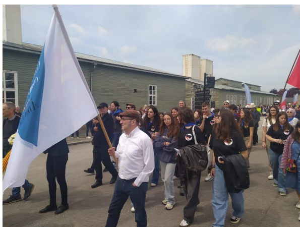
Imatge de la desfilada internacional.